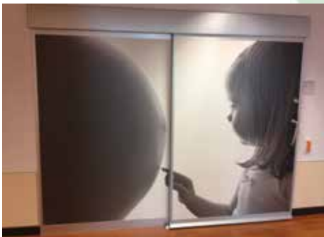
Hermetisk tæt, automatisk skydedør record CLEAN K1-A

record programmet tilbyder et stort udvalg af automatiske døre og periferiapparater til mange former for anvendelser. Kerneprodukter er automatiske skydedøre i lineær og radial udførelse, styresystemer til sidehængte døre, foldedøre, karruseldøre, indbrudshæmmende døre, sikkerhedsdøre til brug i flugt- og redningsveje samt til brandmodstandsprøvning. Disse suppleres af specialprodukter som f.eks. døre til hygiejnisk krævende anvendelser, lufttætte døre, hurtigporte og envejs-gennemgangssystemer.